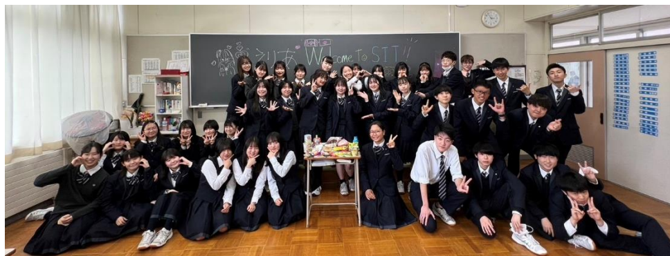
HRクラスで記念写真