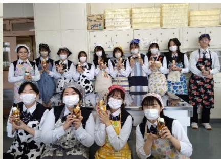
パートナーの2人(左)、調理実習の様子(右)